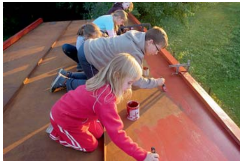
malování na střeše