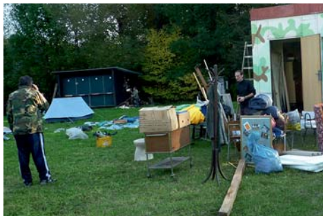
úklid v buňce