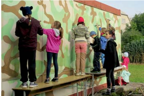
obnovení maskáčové buňky