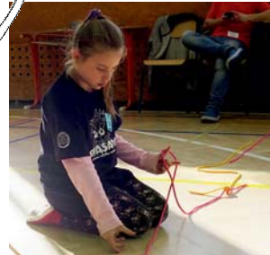
Tete vázala podruhé, zlepšila se o tři čtvrtě minuty.