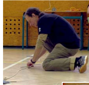
Maty vázal potřetí a zlepšil se o 7 vteřin.

Řešení z minulého čísla: lodní, ambulantský, rybařický, zkracovačka, škoták, dračí