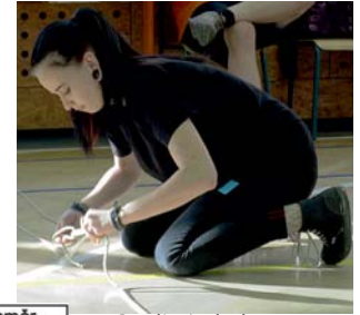
Barča byla letos z oddílu nejlepší. Poprvé mezi Mořskými vlky, a dostala se do finále.