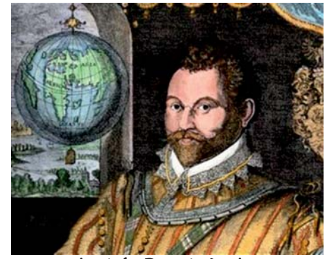
kapitán Francis Drake

Angličtí panovníci, počínaje královnou Alžbětou, začali otevřeně podporovat korzáry – v podstatě piráty, kteří měli k přepadání nepřátelských obchodních lodí v době války vladařem své země vystavenou pověřovací listinu. Ti, kteří takové pověření dostali, pak museli část lupy odevzdávat dvoru.