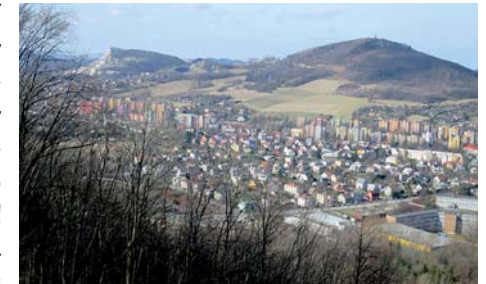
výhled z hřebene na Kopřivnici

Po prudkém stoupání od Janíkova sedla pokračuje cesta pozvolným klesáním po hřebeni až k naučné stezce.