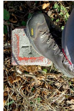
vrchol je dobyt...