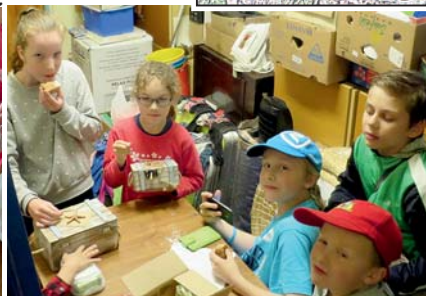
zpět s pokladem obědváme