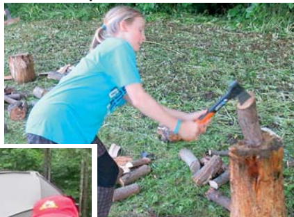
korzáři hýbejte se