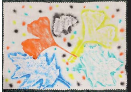
vytvořila Lucka podruhé