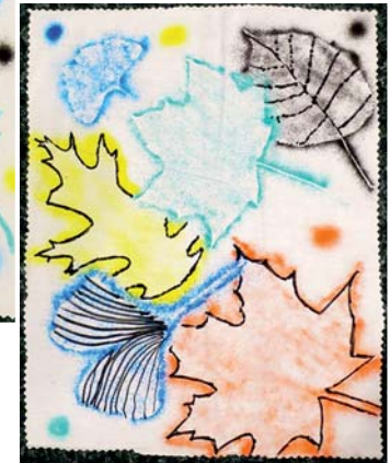
vytvořila Veverka podruhé