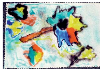
vytvořil Maťo podruhé