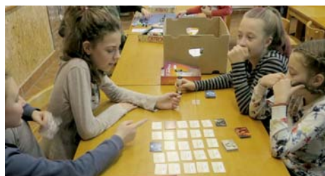
deskovky v jídelně