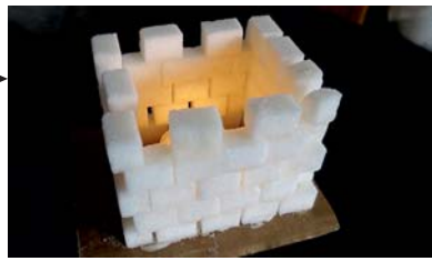
vytvořil, jako vzor, Milach