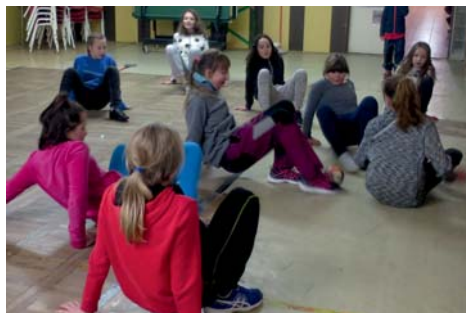
úvodní dovednosti — krabí fotbal