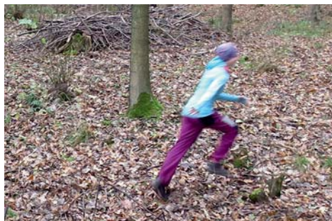
boj o vlajky