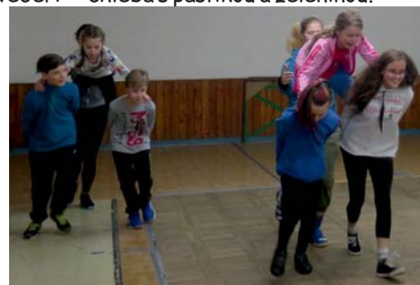
souboje v tělocvičně