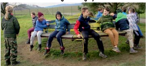
kolotoč, oblíbené místo