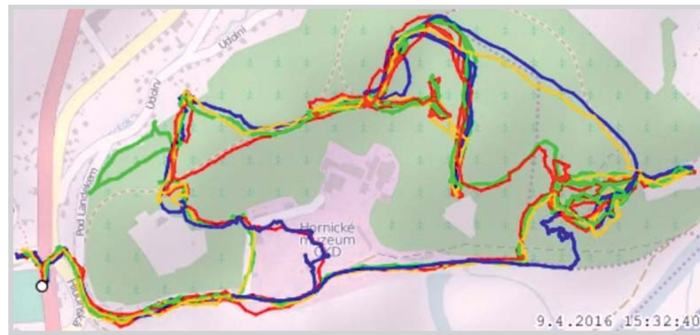
záznamy z GPS z Landeku - červená - StT, žlutá - BaO, modrá - ZaV, zelená - VeP

Narazili na rošt, pod ním na bednu a v bedně opravdu byla Zlatá pagoda. Udělali jsme několik pamětních fotek a pak se spustili, docela prudkým klesáním na cestu podél Odry.