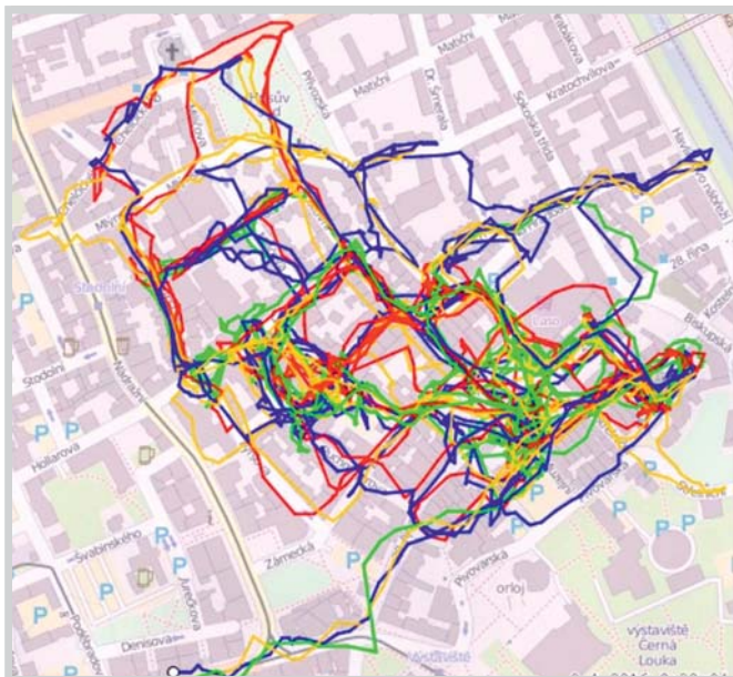
záznamy z GPS z centra - červená - StT, žlutá - BaO, modrá - ZaV, zelená - VeP