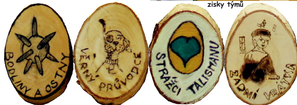
průvodci si připravili pro své týmy placky