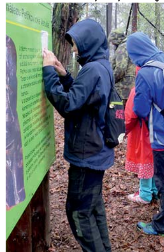
první venkovní zpráva

Po snídani jsme se připravili na putování, vybavili se deštníky a vyrazili jsme na tramvaj.