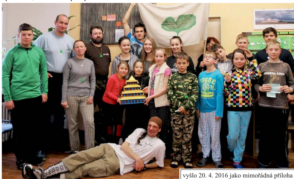
společná fotka na závěr, v suchém a v teple...

vyšlo 20. 4. 2016 jako mimořádná příloha oddílového časopisu Siháček č. 268