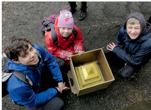
s otevřenou bednou

Každý dostal přívěšek s listem ginga a rozdali jsme si kartičky nebo lístky s nápisy či zprávami, které se týkaly historie Uctíva-