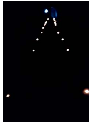
štolka byla osvětlená, a na konci byl deník

Po chvilce přemýšlení se všem týmům podařilo místo najít a vyrazili k němu.