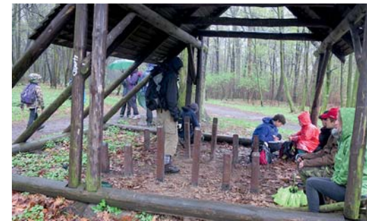
přístřešek směřující k třetinám zprávy

No a tady se dají hledat příčiny dalšího vývoje. Po správné cestě šly dva týmy. Zbývající pokračovaly po