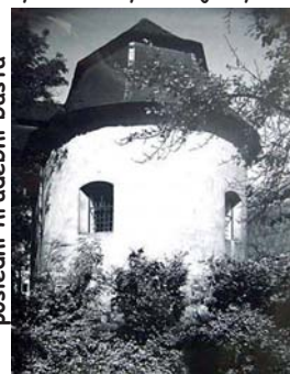
poslední hradební bašta