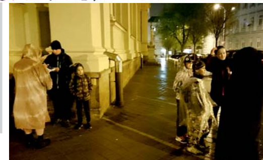
setkání s mnichy

Poslední dvě zprávy navedly týmy k bývalému Uctívači. Museli se mu prokázat propust-