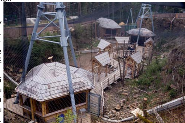
pohled na areál voliér

Šumavský sovinec pečuje o ptáky, kteří mají buď nějaký handicap, nebo pochází z odchovů. Například nový výr velký utrpěl úraz elektrickým proudem. V záchrané stanici v Klášterci ho vyléčili, ale kvůli těžkému zranění a následné amputaci křídla se už nemůže