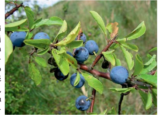
plody slivoně trnky

Na světě je kolem 430 druhů rodu Prunus, převážně rostoucích v mírných šířkách severní polokoule. Květy jsou většinou bílé až růžové, s pěti korunními lístky a pěti kališními lístky. Rostou samostatně nebo v květenstvích. Plodem je vždy peckovice s relativně velkou