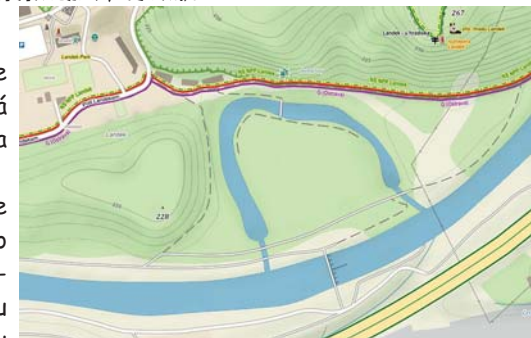
»ostrov« u Odry na Landeku

Čtrnáct měsíců trvalo navrácení vod Odry do jejího původního koryta v místě dosud zaneseného slepého ramene (2014-15). Během stavby byl vytvořen takzvaný rybochod, který má umožnit migraci ryb, které dosud bránil zmíněný jez na řece.