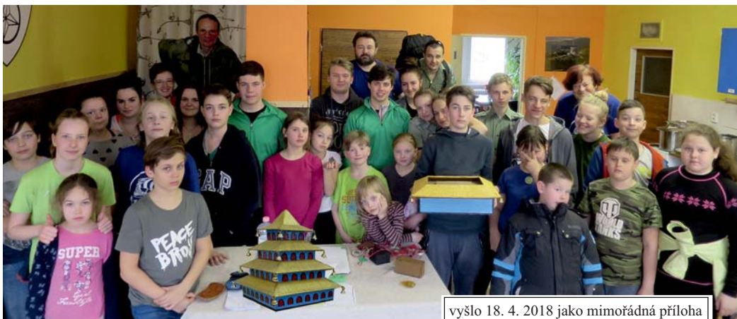
společná fotka na závěr, s talismany...

vyšlo 18. 4. 2018 jako mimořádná příloha oddílového časopisu Siháček č. 308