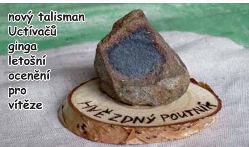
nový talisman Uctívačů ginga letošní ocenění pro vítěze

Potom jsme si řekli, jestli bude Gingo pokračovat (plány by byly), udělali společnou fotku a pustili se do jídla. No a pak už jenom balení, úklid a každý se pustil k místu svého bydliště. Takže příští rok v Novém Jičíně?