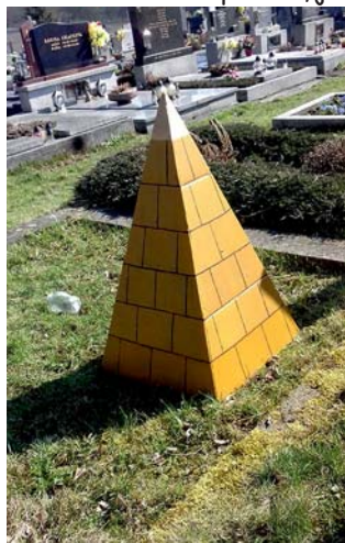
pyramida, a v ní zpráva

Vyluštěno - byla to morseovka - měli všichni velmi rychle. Protože u spojů jsme byli vázání možnostmi MHD, bylo nutné stihnout startovní okno. Překvapilo mě, jak rychle se všichni byli schopni připravit pro odchod na tramvaj. (cena rychlého vyběhnutí se záhy ukázala - nikdo se nepodíval na jízdní řády na okně, takže si nebyli jisti, jak se do Koblava dostat, a polovina týmů chyběla mapa