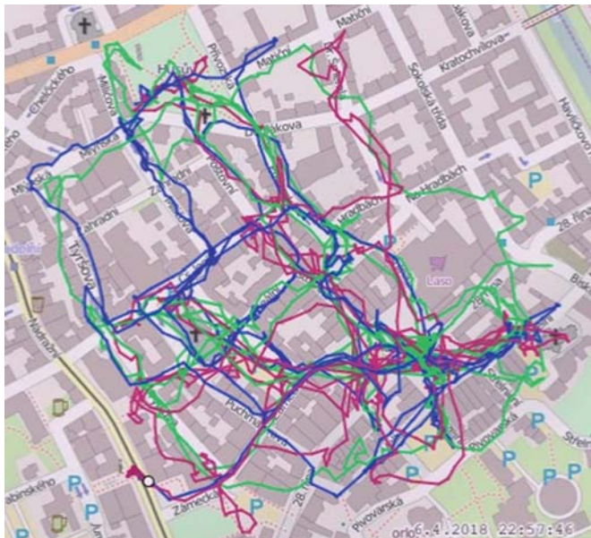
záznamy z GPS z centra - přístroje byly tři, měl je vždy jeden tým ze zúčastněných oddílů SOBOTA

Po přiměřeně klidné noci jsme odpočinutí překonali nástrahy vstávání a pustili se do snídani. Posilnění jsme si vyslechli několik slov k tomu, co nás dnes čeká, dostali zprávu a pustili se do luštění.