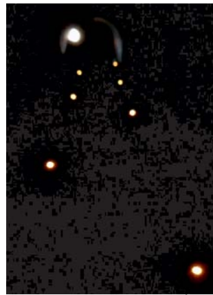
šťola byla osvětlená, a na konci byl mnich

Tak začalo naše putování. Vyluštít, přečíst kam se vydat a co splnit a pokračovat dál, od