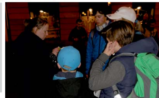
setkání s mnichy

Vontové se rozprchli a mnichové se připravili na své vystoupení. Úvodní zprávu vyluštili všichni velmi rychle a tak jsme se potulovali v Husově sadu a čekali na první příchod mnichů. Od nich jsme pak