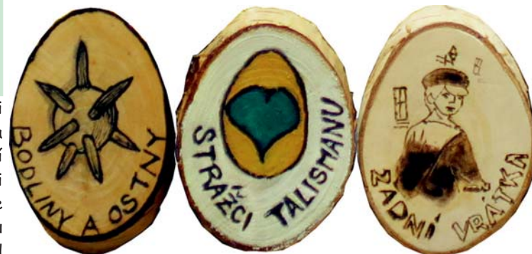
placky týmů, které zastupovaly náš oddíl

Heslo, které nám z šesti písmen vyšlo, bylo KOBLOV. A tam zítra budeme začínat.