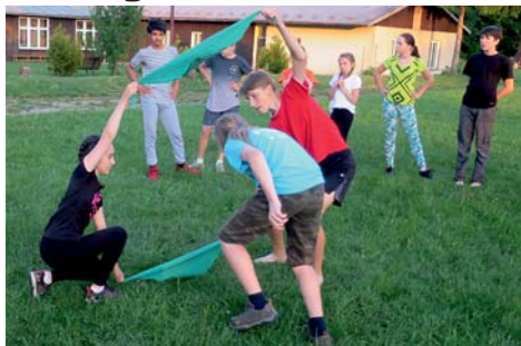
přelez-podlez-prolez a oběhni

Poněkud později než jsme plánovali, ale nemuseli jsme alespoň topit. Navíc se předpověď vyplnila a tak jsme si užívali teplých dnů pozdního jara.