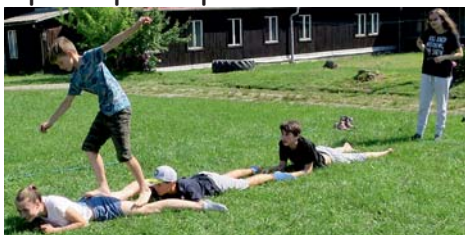
mravenci v medu