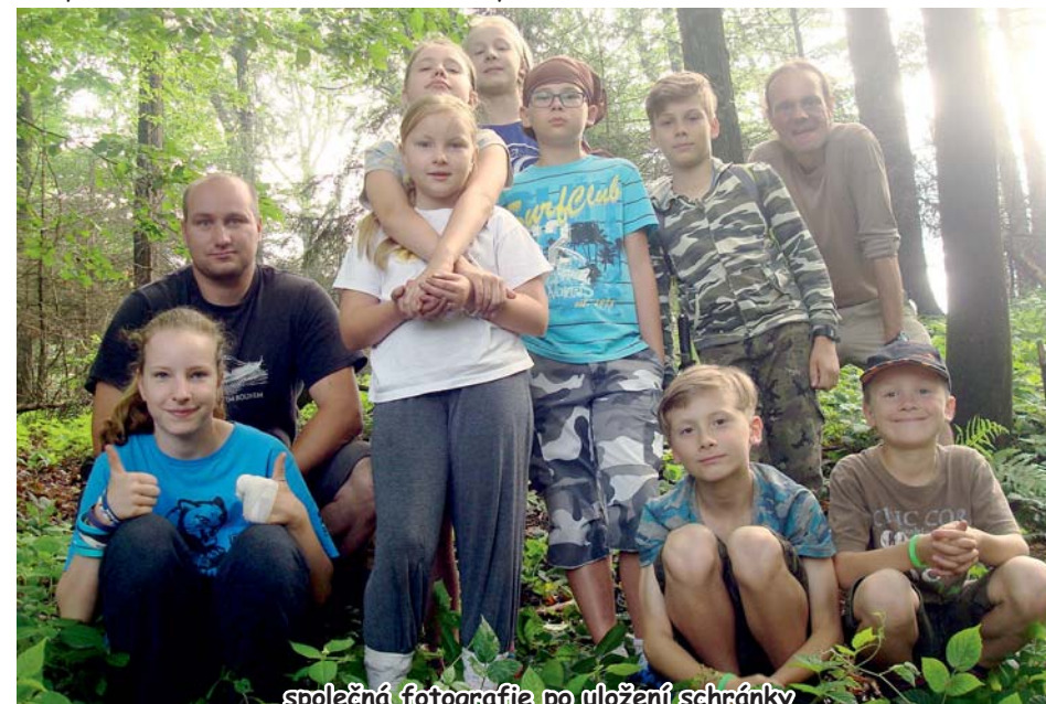
společná fotografie po uložení schránky