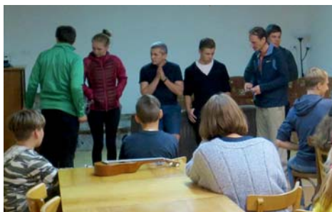
úvod do Hunger Games

Bylo krásné počasí a my si užívali teplých prvních podzimních dnů.