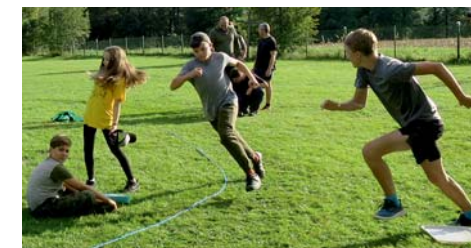
živé človrče nezlob se