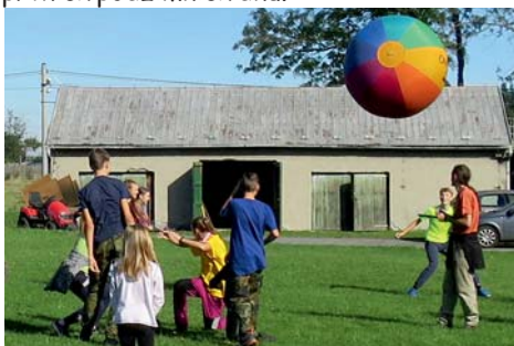
Kin-ball — odpal