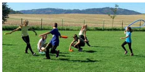
Jagger — hra soubojů a taktiky