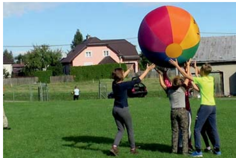
Kin-ball — držení