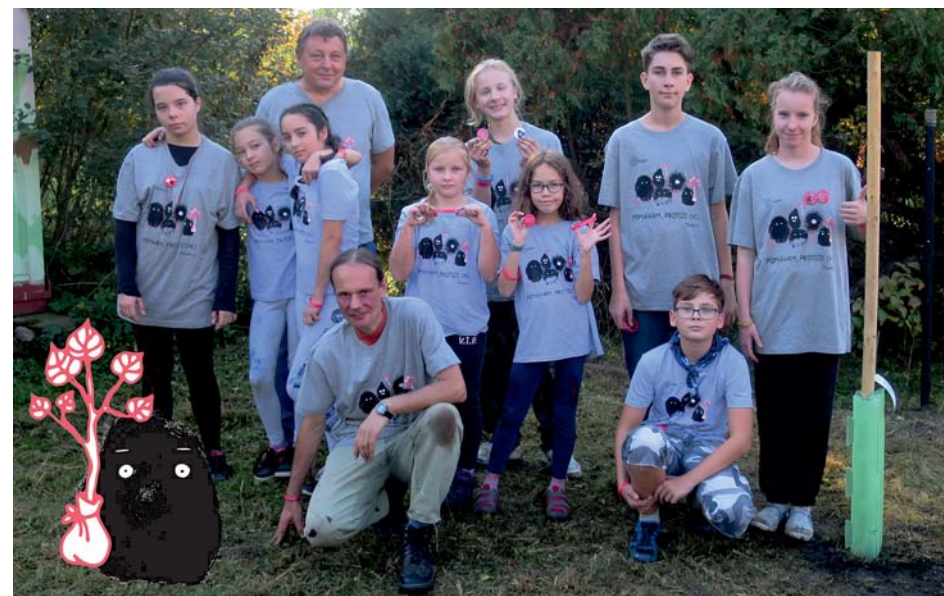
společná fotografie před opékáním