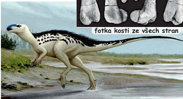
rekonstrukce vzhledu dinosaura

(„Burianův ještěr“) byl druh menšího či středně velkého ornitopodního dinosaura, žijícího na území dnešní České republiky v období rané pozdní křídy (asi před 94 miliony let) na území Kutné Hory. Druh byl popsán v roce 2017 skupinou paleontologů na základě objevu fragmentu stehenní kosti, učiněného na jaře roku 2003