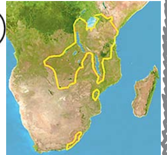
rozšíření damana stromového