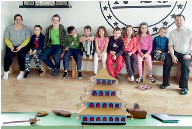
Ještěrky už po našem odchodu - na závěr, s talismany

Cesta vlakem a tramvají proběhla taky bez komplikací