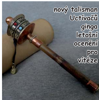
Posel se svítkem - tibetský mlýnek

vyšlo 10. 4. 2019 jako mimořádná příloha oddílového časopisu Siháček č. 327