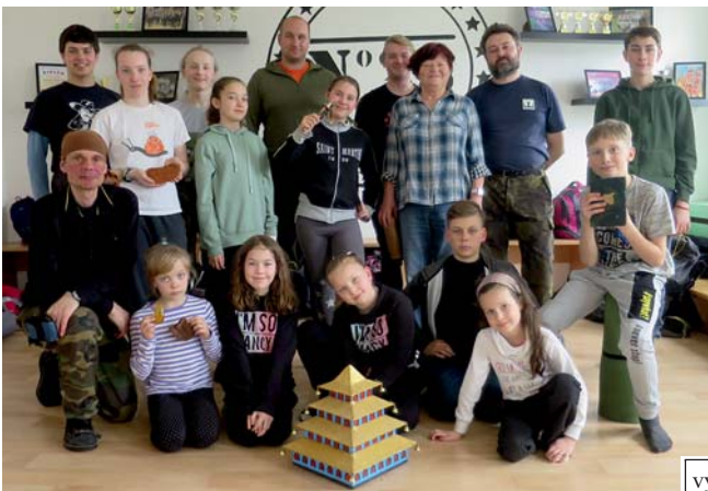
společná fotka na závěr, s talismany...