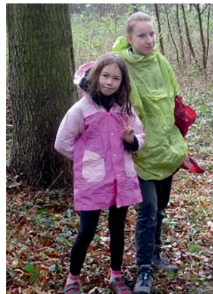
během cesty začalo pršet

Všechny ostatní týmy se zadrhly na zprávě, která obsahovala (dle mého jen) zmínku