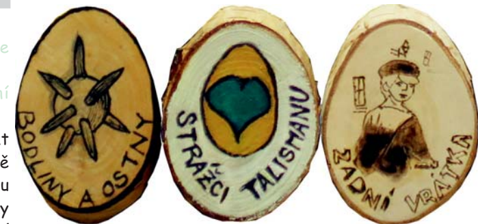
placky týmů, které zastupovaly náš oddíl