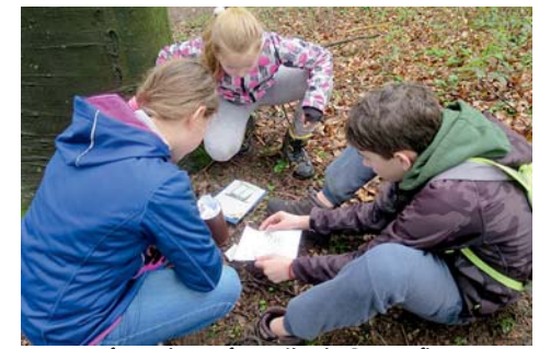
zpráva, která vedla k Poutníkovi...