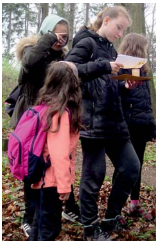
zpráva se svíčkou

K prameni se dostala ještě Veverka, a tak i Bodliny a ostny. Cesta na středisko už byla jen takovým zpestřením. Tam jsme se najedli a začali balit. Když jsme opouštěli křižovatku před studánkou, stáhli jsme