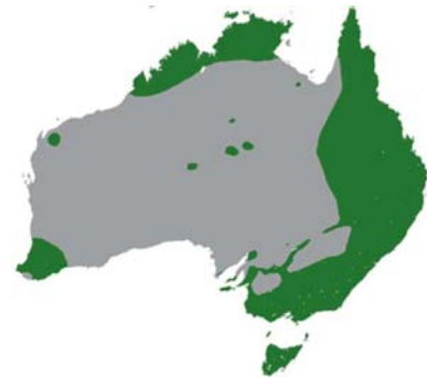
roziřeni Kusu liščího

TERRA AUSTRALIS — ZEMĚ NA JIHU, JE ZNÁMÁ VÝSKYTEM ŽIVOČICHŮ, KTERÉ JINDE NA ZEMĚROU-LI NENAJDEME. JSOU TO VAČNATCI. JEJICHŽ MLÁDATA ŽIJÍ DO URČITÉHO VĚKU VE VAKU SAMICE.