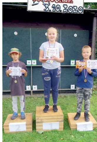
stupně vítězů první kategorie