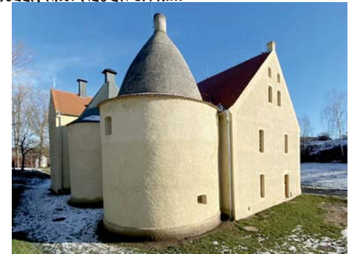
zadní část sušárny s kruhovými věžemi

Od devadesátých let minulého století začaly sušárny postupně ztrácet svůj význam. Vlivem nových technologií se