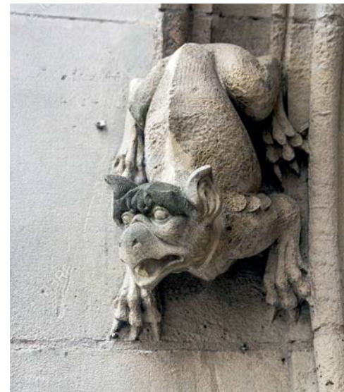
jeden z chličů v severofradouzském městě Rouen

Stejně panovalo přesvědčení, že chrliče odpuzují zlo. Proto je stavěli