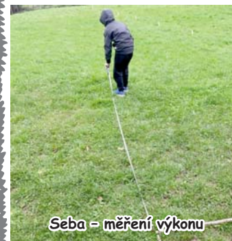
Seba - měření výkonu