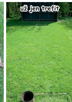
už jen trefit

WEB: www.volny.cz/sihasapa vyšlo: 12. 5. 2021