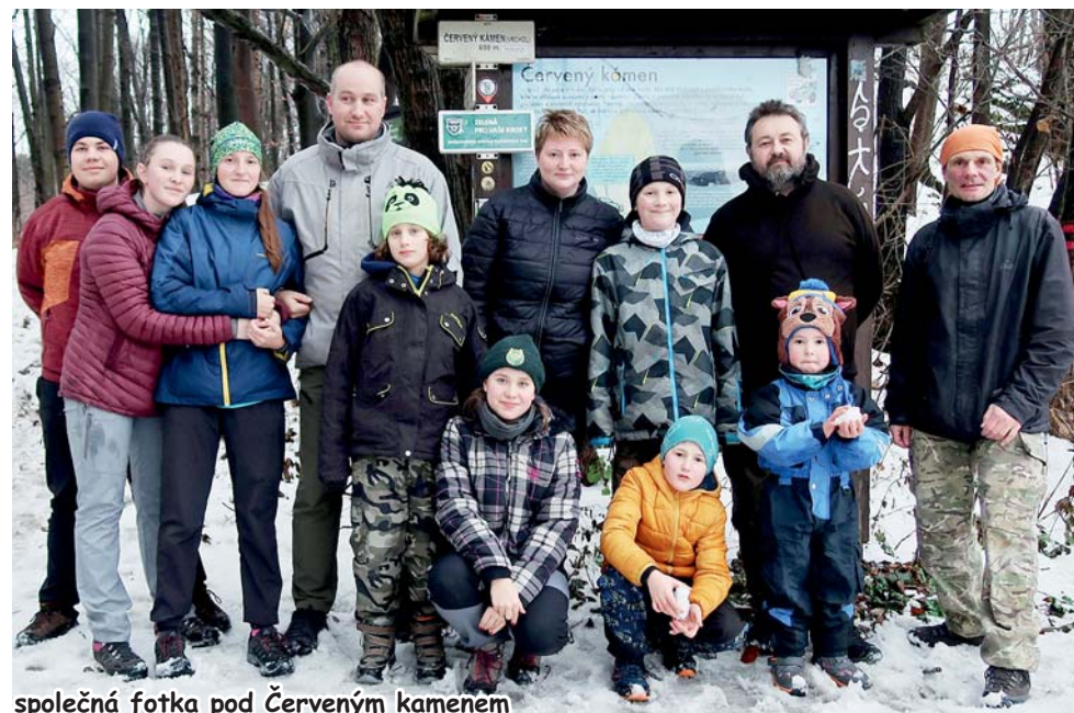
společná fotka pod Červeným kamenem