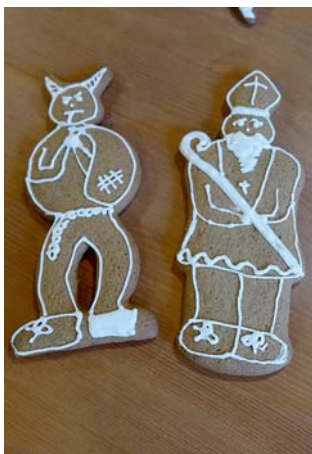
zdobili jsme čerty a Mikuláše