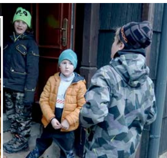
návrat z výšlapu