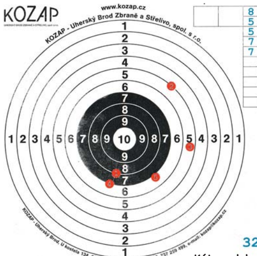
Kája - leh