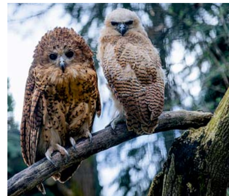
Ketupy, mládě vpravo

Zoo Praha chová ketupy Pelovy od roku 2019, kdy dva páry získala ze specializovaného chovného centra na sovy v italském Monticellu. V rámci Evropy jsou tak chovány pouze v Zoo Praha, která se letos stala první zoologickou zahradou na světě, která ketupu Pelovu úspěšně odchovála.