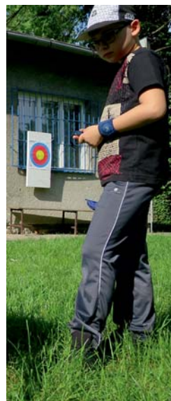
střelbu doplňujeme i foukačkou