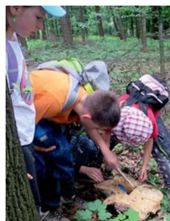
„schránka“ či slo tři