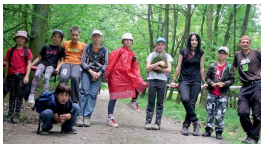
společně na řetězovém mostě