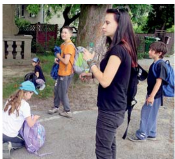
před odbočení m do Palésku