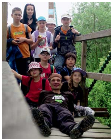
společně na řetězovém mostě