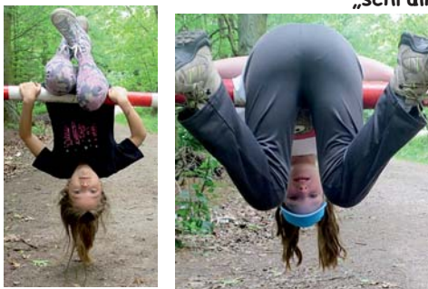
jak se visí na závoře