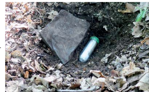
oddílová schránka — tuba zakrytá kamenem

Na snídani jsme měli buchty a tvarohovo-kakaovo-meruňkovou buchtu — obojí bylo velmi dobré, a zapíjeli jsme bílou kávou nebo čajem. Potom jsme si chvíli povídali o cíli našeho dnešního putování.