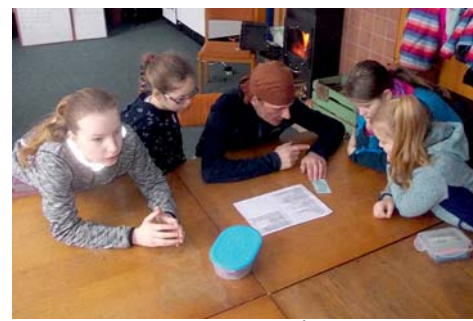
budeme plnit úkoly