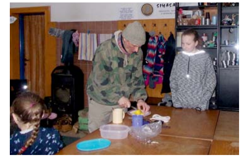
trocha vitamínů :-D

A to už byl před námi poslední kousek cesty — přes louku přímo „po lince“ k naší pro dnešek