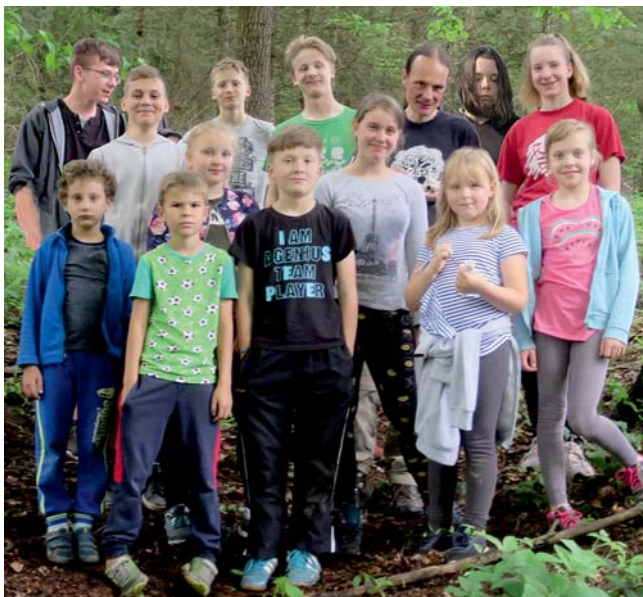
SIHASAPA po uložení zprávy do schránky

Letní tábor letos proběhl od 17. července do 1. srpna, tradičně, jako v minulých letech, na louce poblíž Raduňského zámku. Tématem byla Škola čar a kouzel. Inspirována příběhy Harryho Pottera v Bradavicích