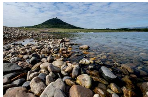
břehy jezera lemují oblázkové pláže

Jezero má rozlohu 311 ha, délku 2,5 km a šířku 1,5 km. Hladina je v nadmořské výšce 199 m. Jezero se nachází mezi městem Most a obcí Braňany, přímo pod kopcem Hněvín (399 m n. m.), na místě starého města Most.