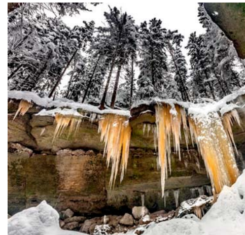
některé části nejsou pro návštěvníky přístupné

Stávající teorii ale v roce 2008 vyvrátili vědci z brněnského Botanického ústavu. Zjistili totiž, že zbarvení způsobuje