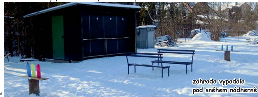
zahrada vypadala pod sněhem nádherně