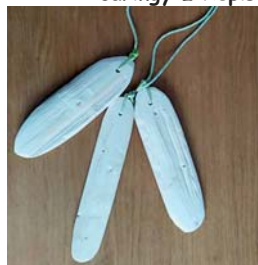
čarinky z řepišť

Nazdar luštitelé. Dnes je pro vás připravena spojovačka. Spojte čarou tečky podle číslic, jak jdou za sebou. Teď už zbývá jen odpovědět na otázku: Co je na obrázku?