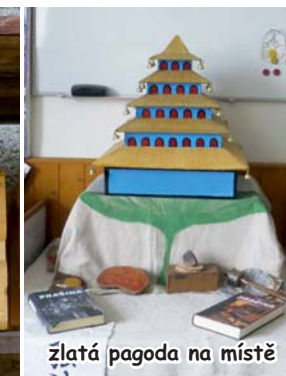
žlutá pagoda na místě