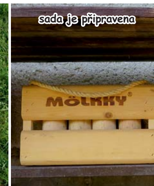
sada je připravena