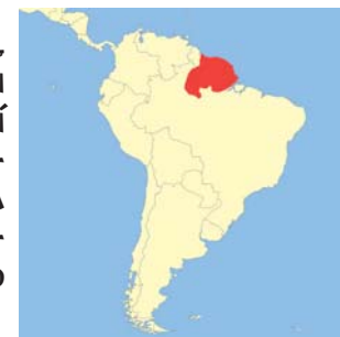
výskyt Tamarína žlutorukého

Žije ve skupinách čítajících od 4 do 15 členů s menší konkurencí mezi samci v oblasti rozmnožování. V období množení rodí mláďata vždy jen jedna samice ve skupině. O mladé tamaríny se starají primárně otcové, ale v péči se střídají i další členové skupiny. Prioritou ve skupině je obrana, a pokud je jeden z tamarínů