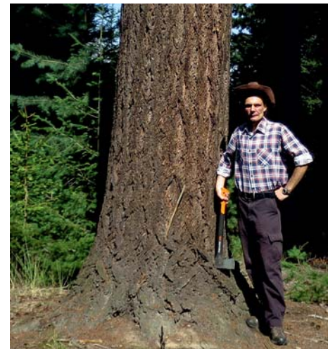
když jsem se vydal fotit, vzal jsem si stylové oblečení

Vzhledem ke vlastnostem, roste dvakrát rychleji a nemá u nás přirozené škůdce, se oní uvažovalo jako o náhradě smrku. Předběžná opatrnost však její využití brzdí, takže je možné ji vysazovat pouze jako meliorační a zpevňující dřevinu.