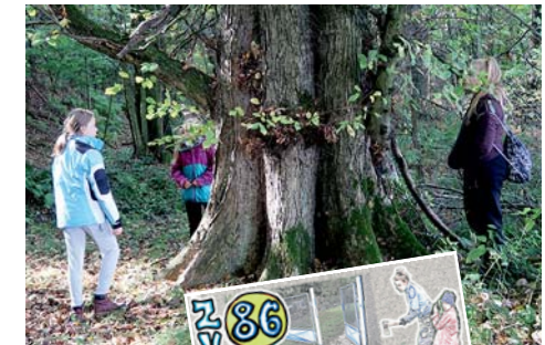
DOS 9 největší