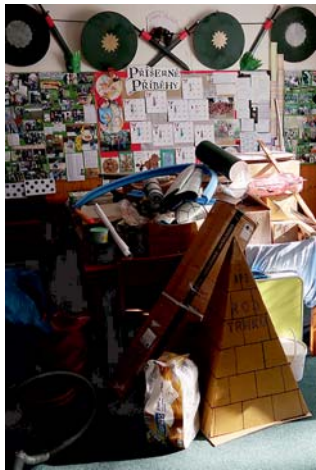
ted' ještě zpět