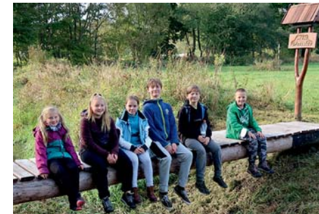
společně na mostě