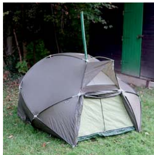
má milovaná GEMMA