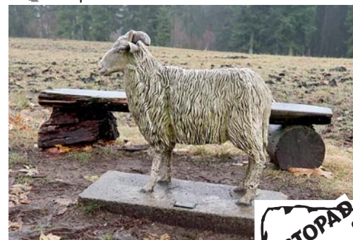
známá socha ovce Valašky

Poslední klesání z Bílého kříže na Visalaje jsme zvládli v dobrém tempu, takže jsme si mohli dopřát i druhou jídelní přestávku v místní chatě.