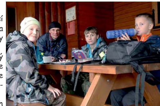
naše první přestávka na jídlo byla na Svárné Hance

Další cestu jsme už jen ve vlnách stoupali a klesali v rozmezí desítek metrů.