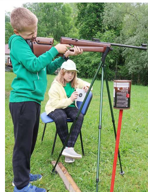
z plynovek střílíme s podporou