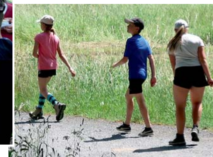
Zpět už jsme šli nalehko.