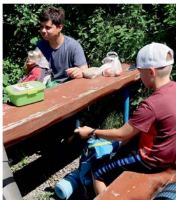
Svačíme poté, co jsme vystoupali ze Zátíší.