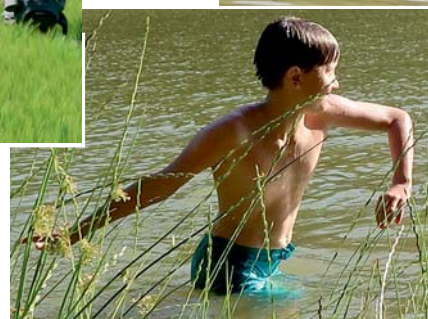
Po odpoledních hrách jsme se vydali k vodní ploše vykoupat