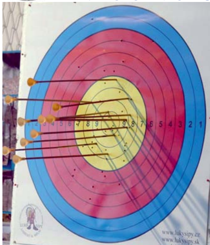
nejlepší z foukačky byla Kája ml.