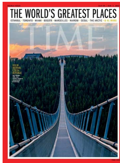
titulní strana časopisu TIME