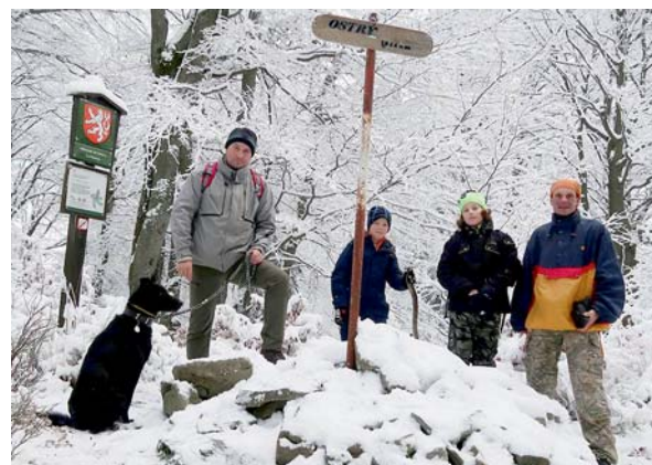
bylo nás pět