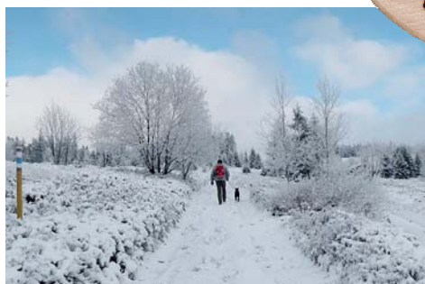
zimní krajinou vzhůru