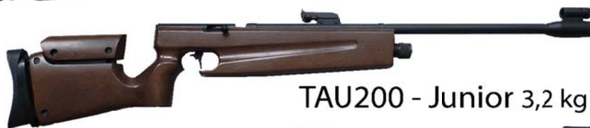
TAU200 - Junior 3,2 kg