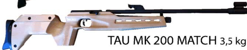
TAU MK 200 MATCH 3,5 kg