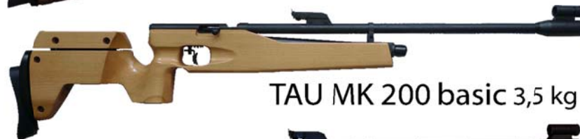
TAU MK 200 basic 3,5 kg