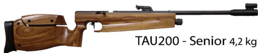
TAU200 - Senior 4,2 kg

verze junior je jediná s univerzální (pravo/levou) pažbou